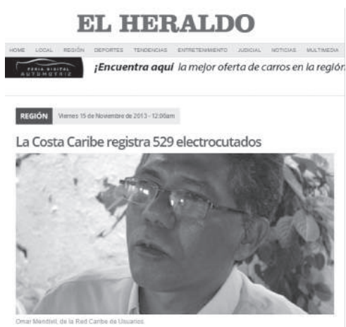
FOTO 6. TITULAR EL HERALDO , ESTADÍSTICAS COSTA CARIBE