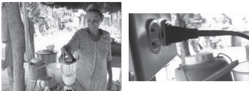
FOTO 4. ADECUACIONES ELÉCTRICAS

En el 2012, por lineamientos del grupo, se le da un nuevo nombre aunque conserva su intención de adecuar las instalaciones eléctricas internas en viviendas de barrios de escasos recursos y una formación adicional en buenas prácticas sobre uso responsable de la electricidad.