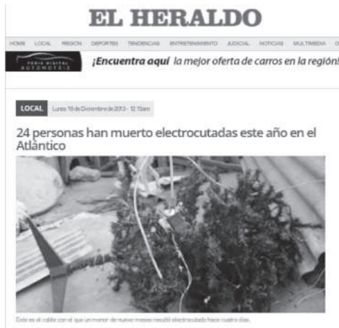
TABLA 18 MUERTES POR ELECTROCUCIÓN EN BARRANQUILLA