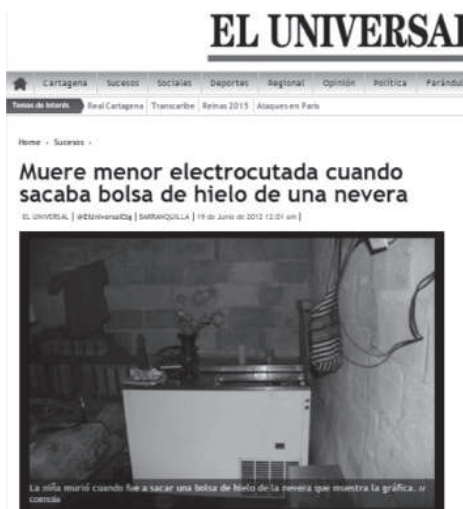
FOTO 5. TITULAR EL UNIVERSAL

Algunos medios de comunicación en el país, han reportado el tema de la accidentalidad por mal manejo de las instalaciones eléctricas por parte de los usuarios o de electricistas empíricos, en la costa Caribe, tal y como lo muestran las imágenes a continuación: