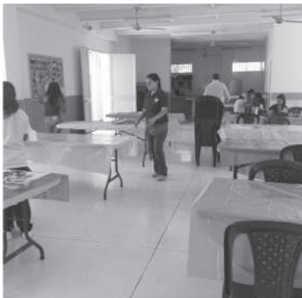
FOTO 10. ADECUACIÓN COMEDOR ESCOLAR

Fuente: Registro fotográfico en visita de campo