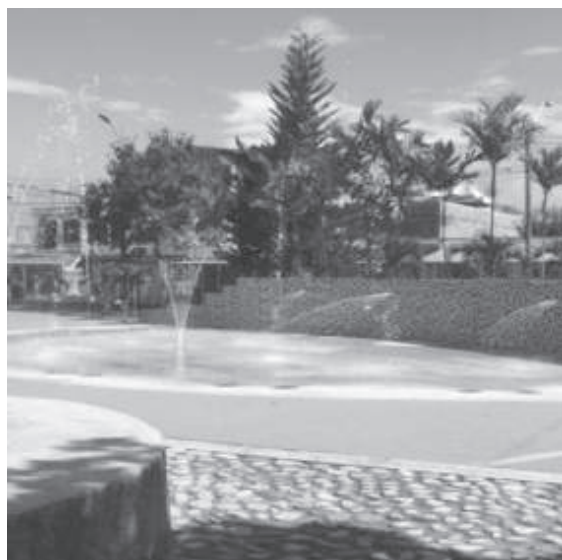
ZONA DE CHORROS, PARQUE LAS ACACIAS