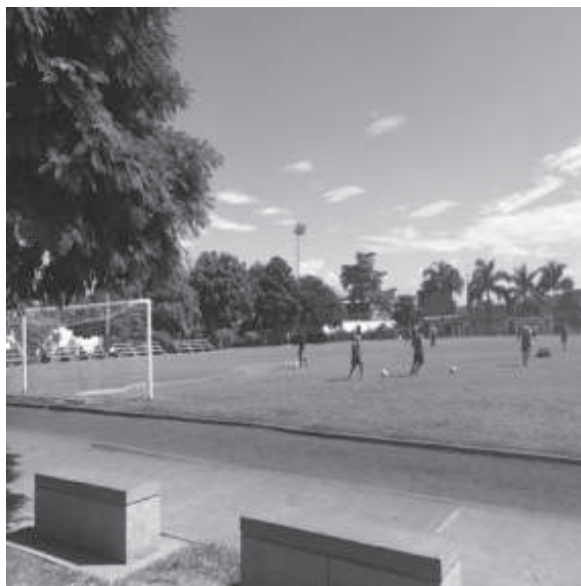
CANCHA DE FÚTBOL PROFESIONAL, PARQUE LAS ACACIAS