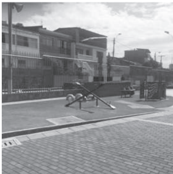
FOTO 16. PARQUE LA HORQUETA

Fuente: Registro fotográfico en visita de campo