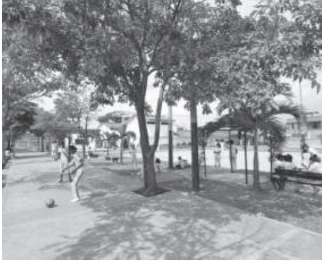
FOTO 12. PARQUE LAS ORQUÍDEAS, DESPUÉS DE LA INTERVENCIÓN DE LA FUNDACIÓN FANALCA