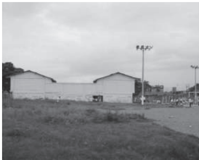
FOTO I I . PARQUE LAS ORQUÍDEAS, ANTES DE LA INTERVENCIÓN DE LA FUNDACIÓN FANALCA