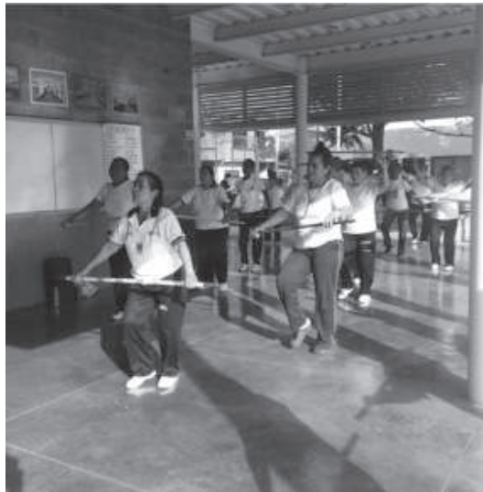
FOTO 13. GRUPO ADULTO MAYOR - CLASE DE BAILE, PARQUE LAS ORQUÍDEAS