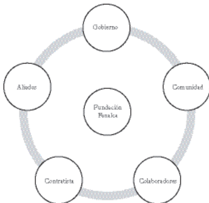
GRÁFICO 14. GRUPO DE INTERÉS FUNDACIÓN FANALCA