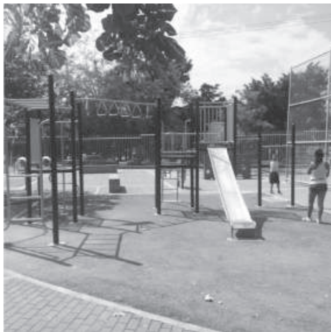
FOTO 17. PARQUE LA HORQUETA

Fuente: Registro fotográfico en visita de campo