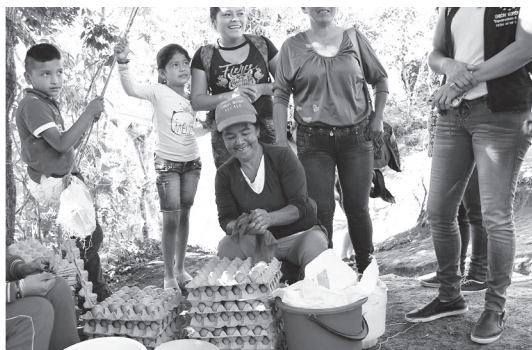
FOTO 2. MUJER PARTICIPANTE Y MIEMBRO DE ASOMUCADI - ASOCIACIÓN DE MUJERES AGROINDUSTRIALES, PECUARIAS Y AMBIENTALES DE DIVISO