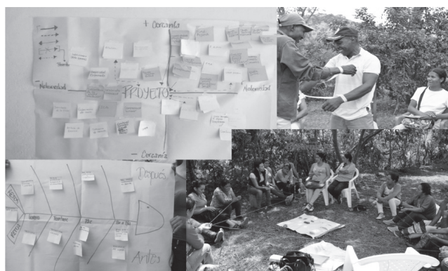
FOTO 1. HERRAMIENTAS METODOLÓGICAS UTILIZADAS EN CAMPO

Fuente: Foto tomada por los investigadores en trabajo de campo, 2018.