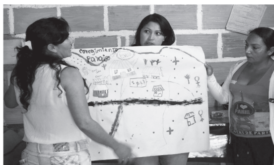
FOTO 3. PRESENTACIÓN SOBRE EL ESTADO DE SU TERRITORIO – GRUPO NO ASOCIADO DE MUJERES DEL CORREGIMIENTO EL PARAÍSO DEL MUNICIPIO DE SUCRE, CAUCA